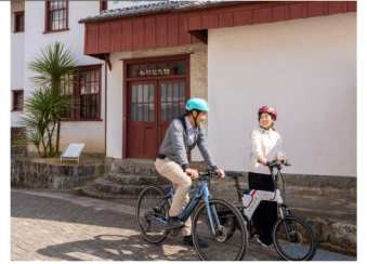
新宮市 旧西村家住宅

一步路地に入るとそこにはレトロな街並みが。和菓子の良い香りや地元の人々の笑い声に心が癒されます。