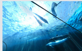
太地町立 くじらの博物館