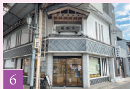
福助堂 那智勝浦店

昭和42年創業の老舗店。地元産を積極的に使用しており、ジェラートも好評。紀伊勝浦駅徒歩2分にあり、お土産やカフェのスペースも完備されています。