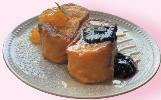
4 monolith自慢のフレンチトースト

一日の嬉しいアクセントが午後のおやつ。 熊野エリアのおすすめスイーツを紹介いたします！