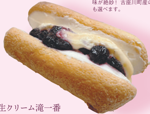
生クリーム滝一番ブルーベリー

スタッフ考案のフレンチトーストに町内三尾川産「天正堂」のブルーベリーを店内でジャムに加工して添えた一品。甘さとジャムの酸味が絶妙！古座川町産のゆずマーマレードも選べます。