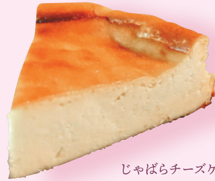
3 じゃばらチーズケーキ

看板商品のプッセに生クリームを挟んだスイーツ。町内太田産の甘酸っぱいブルーベリー＆滑らかな生クリームは、ふわふわのプッセと相性抜群です。期間限定の味がでることも！